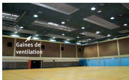
Gainés de ventilation